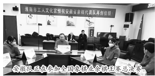
安徽队正在参加全国象棋业余棋王赛总决赛。

本次总决赛通过开设“云端”赛场，为各地从预选赛脱颖而出的象棋爱好者搭建全国性的对弈交流平台。许多参赛队成功实现了线下集中、在线下赛场与其他队伍进行“云端”对弈。这是全国象棋业余棋王赛继上一届之后连续第二次以网络赛的形式举办总决赛。