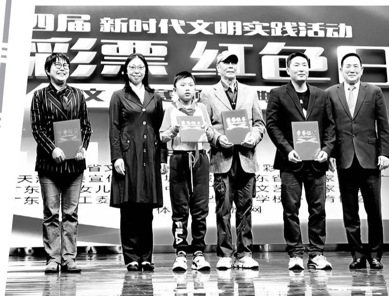
第四届体育彩票·红色日记征文大赛颁奖典礼在广州南沙图书馆举行。