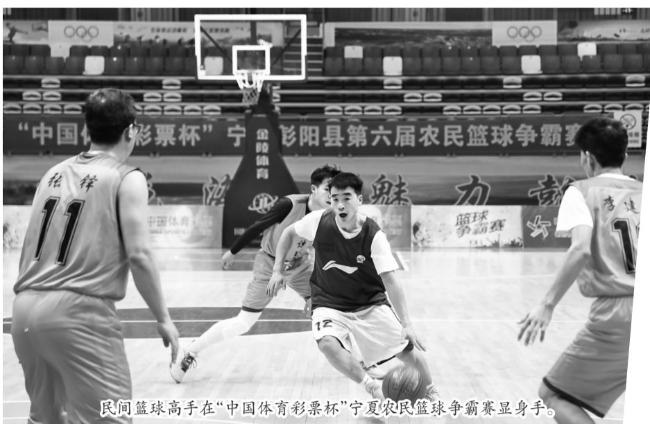
民间篮球高手在“中国体育彩票杯”宁夏农民篮球争霸赛显身手。

宁夏农村历来就有农闲时打篮球的传统，在“体彩杯”农民篮球赛中，永宁县的成绩不错，而原隆村的篮球水平在永宁县名列前茅。每到春节，村里的篮球场都最热闹，村民回来都会约着打篮球，有