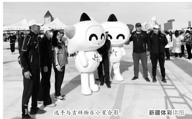
选手与吉祥物乐小星合影。