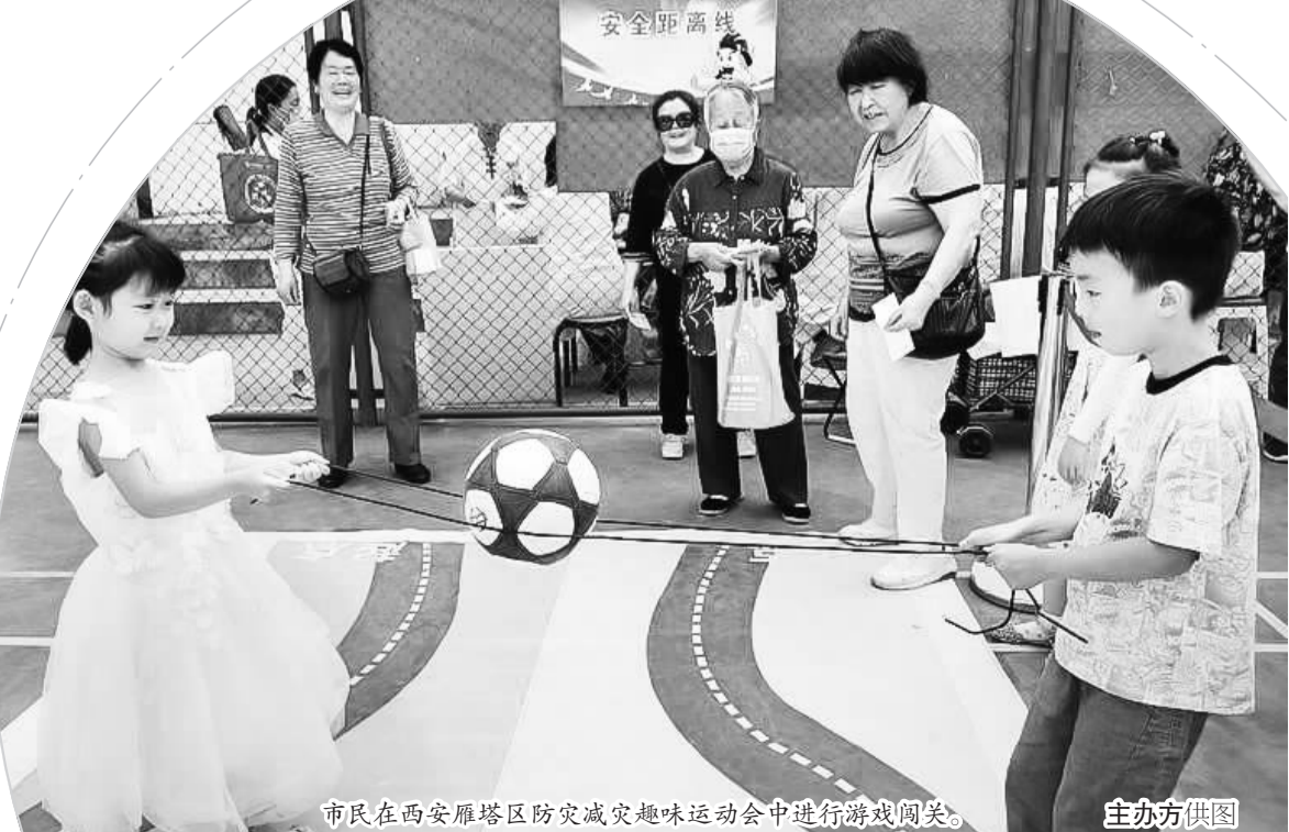
市民在西安雁塔区防灾减灾趣味运动会中进行游戏闯关。