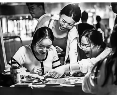
市民体验彩票游戏。

本次活动在激情四射的舞蹈中拉开了序幕，随后播放的济南潮流体育消费季宣传片讲述了近年来提振体育消费信心、繁荣体育市场所取得的发展成绩。活动现场设置了潮玩派、热力派、运动派三个主题区域的潮流体育