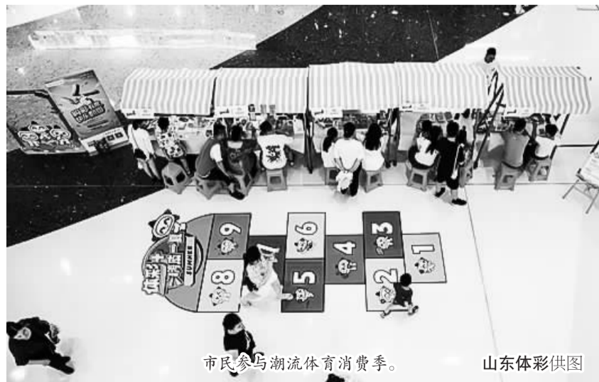
市民参与潮流体育消费季。

在责任彩票宣传区，黄白相间的体彩帐篷、各种主题风格的体彩市集展位彰显了活力，引来三五成群的热情市民来此打卡，或刮彩票试试手气，或在游戏区体验套圈、拆盲盒的乐趣。也有来到打卡墙处，用相机记录下自己与体彩欢乐的美好一刻，还有匆匆来到彩票兑换处，体验购物免费领取大乐透彩票的快乐。“这样的活动真好，既能找到赶夜市大集的乐趣，还能领彩票做游戏，万一幸运中