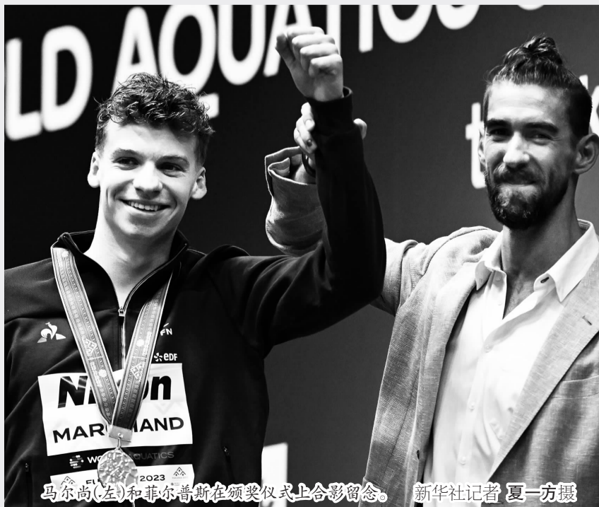
马尔尚(左)和菲尔普斯在颁奖仪式上合影留念。

立陶宛的伦敦奥运会冠军梅卢提特在女子50米蛙泳半决赛中游出了平世界纪录的成绩，在决赛中她捅破了窗户纸，打破了世界纪录，并在福冈收获了50米和100米蛙泳两枚金牌。梅卢提特在伦敦奥运会夺冠时只有15岁，她曾在2019年宣布退役，现在又回到泳池中找回了竞技状态。