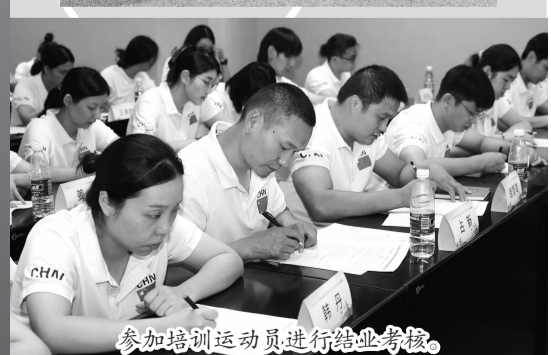
参加培训运动员进行结业考核。