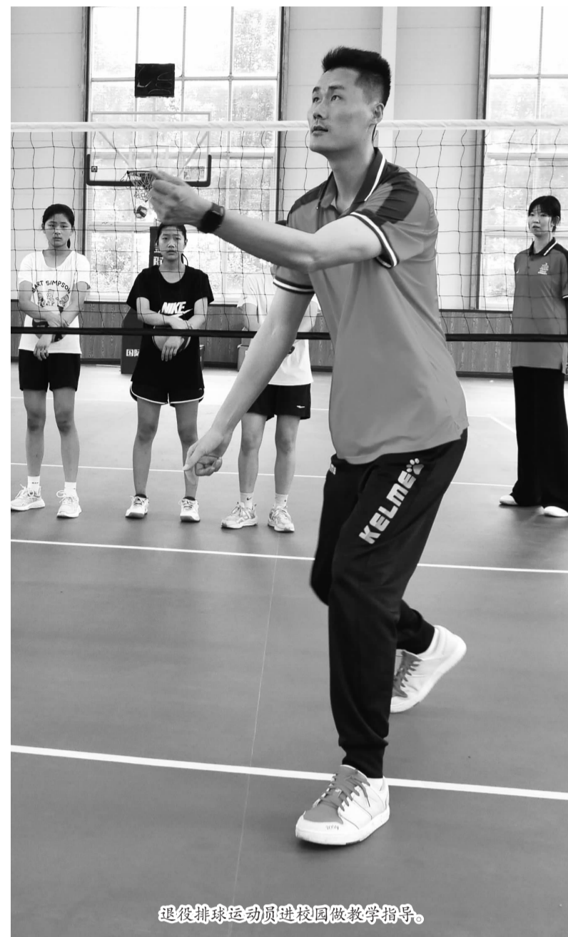
退役排球运动员进校园做教学指导。

今年1月,体育总局、中央编办、教育部、人力资源和社会保障部联合印发了《关于在学校设置教练员岗位的实施意见》(以下简称《意见》),旨在进一步加强学校体育工作,促进青少年健康成长,厚植国家竞技体育后备人才基础。