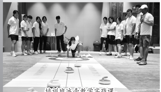
培训班冰壶教学实践课。