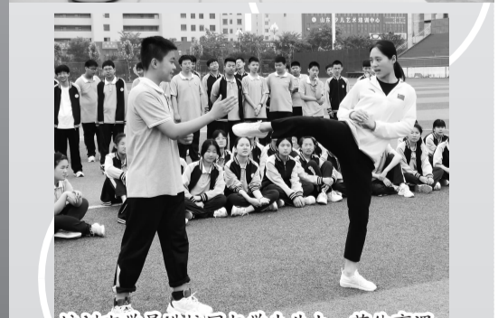
培训班学员进校园与学生共上一节体育课。