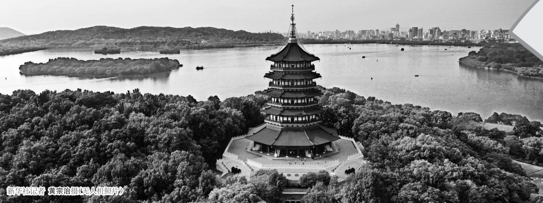
新华社记者 黄宗治摄(无人机照片)