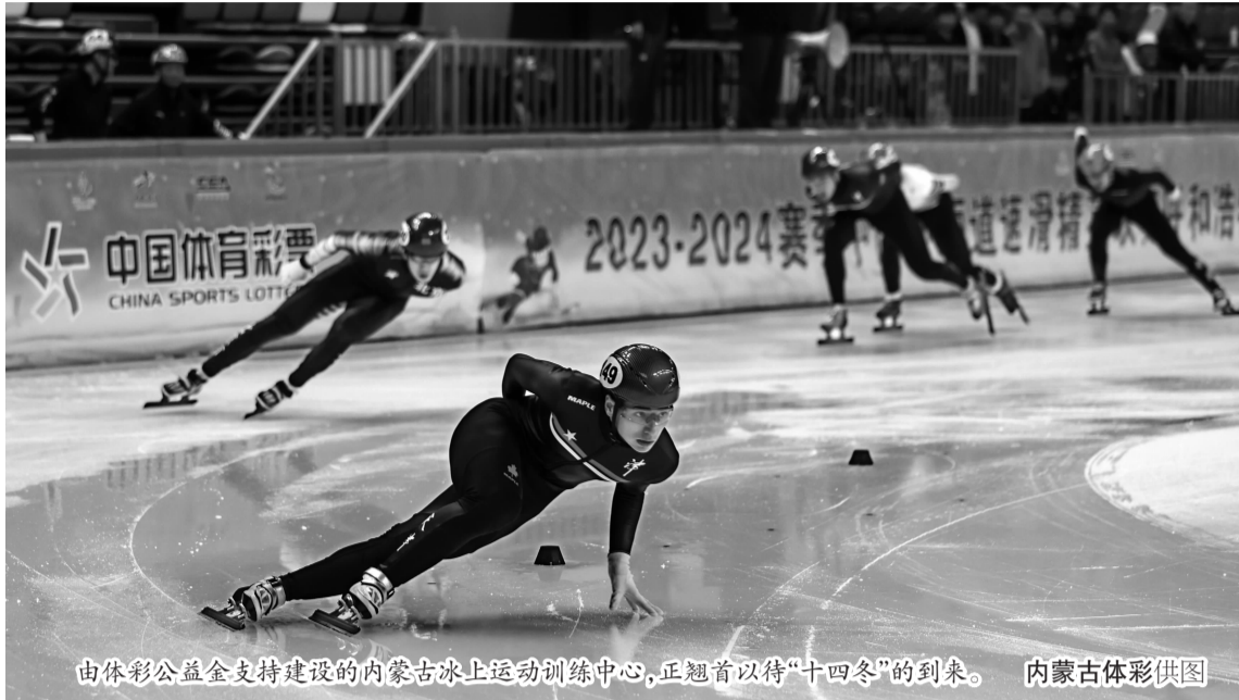
由体彩公益金支持建设的内蒙古冰上运动训练中心,正翘首以待“十四冬”的到来。

三亿人参与冰雪运动”成果的重要任务,内蒙古体育局开展百场“冰雪惠民”系列活动,预计直接参与人数30余万人次,辐射带动健身群众500万人次,让全民共享办赛成果,这背后离不开体彩公益金的贡献。”内蒙古体育局局长杜伯军表示,作为国家公益彩票,体彩公益金从建设冰雪场地设施,到丰富群众赛事活动供给,再到探索冰雪运动融入生活,让“十四冬”的热浪在内蒙古这片冰天雪地上腾涌澎湃。