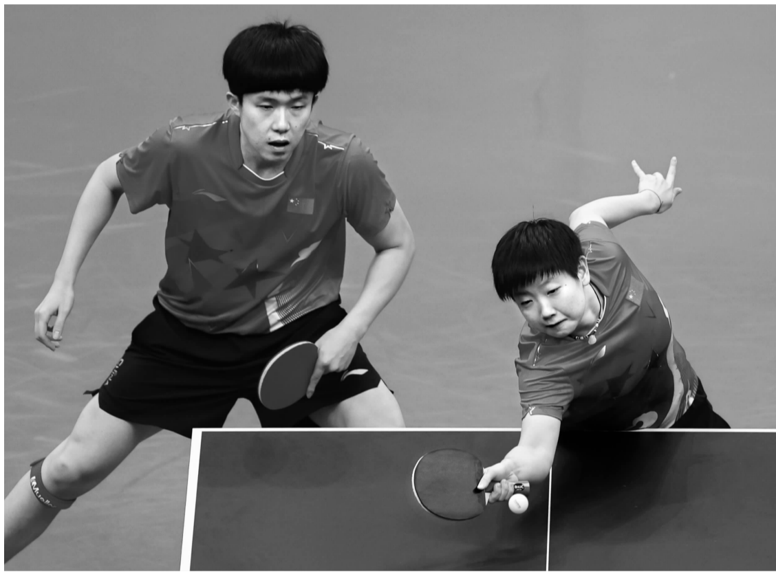
王楚钦（左）、孙颖莎在比赛中。