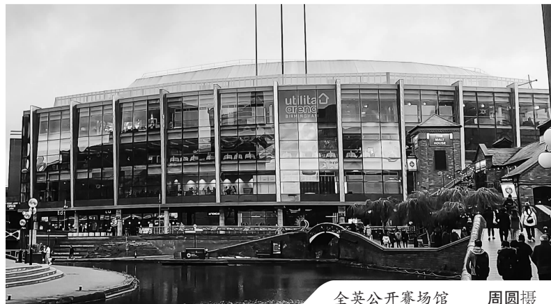
全英公开赛场馆

今年的全英公开赛也是奥运积分赛,吸引了中国、日本、马来西亚、印尼、丹麦等国家和地区的多家媒体记者前来现场报道,让全英公开赛的热度再次提升。