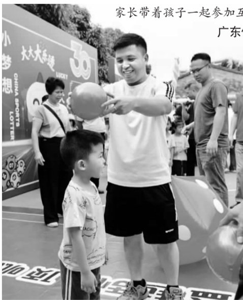
家长带着孩子一起参加互动游戏。