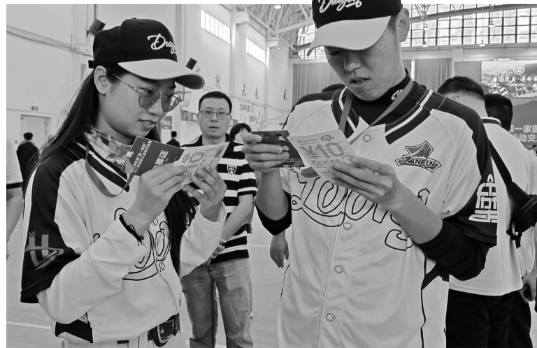
参赛运动员体验顶呱刮即开票。