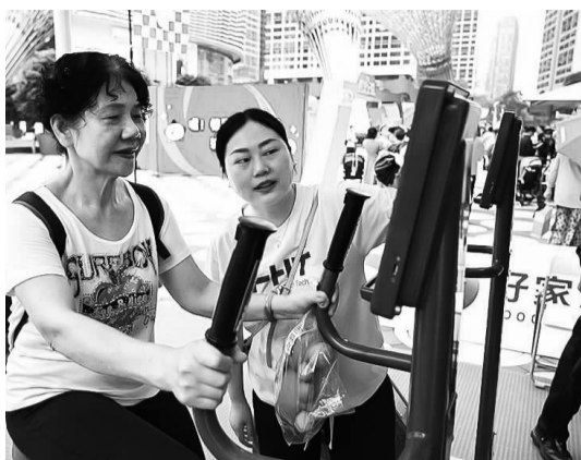
居民在数字联动智能骑行赛中。