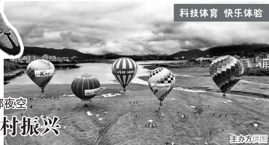
科技体育 快乐体验